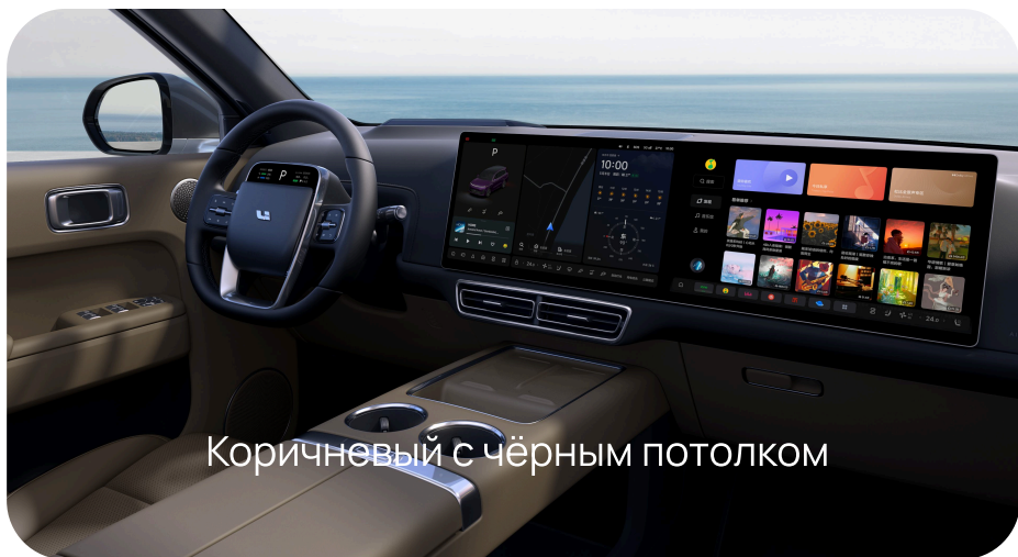
Коричневый с чёрным потолком