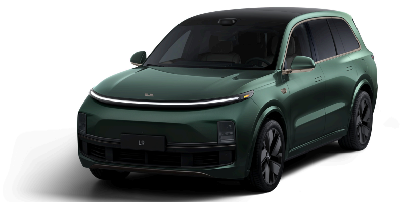
Глубокий зелёный жемчужный - Особая серия 1