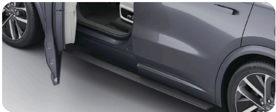
Выдвижные пороги с электроприводом

Легкосплавные колёсные диски чёрно-серого цвета