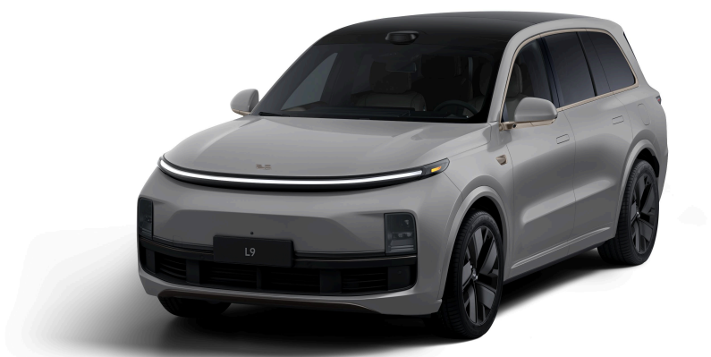
Элегантный серый - Особая серия 1