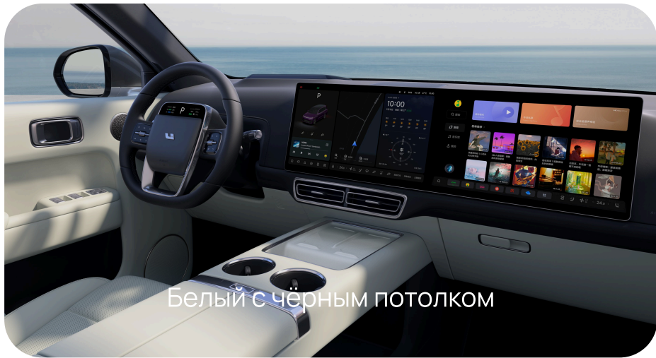
Белый с чёрным потолком