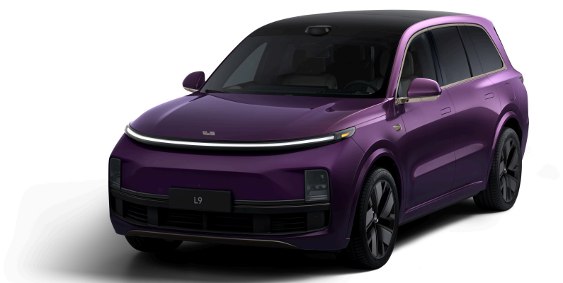
Жемчужный фиолетовый - Особая серия 1