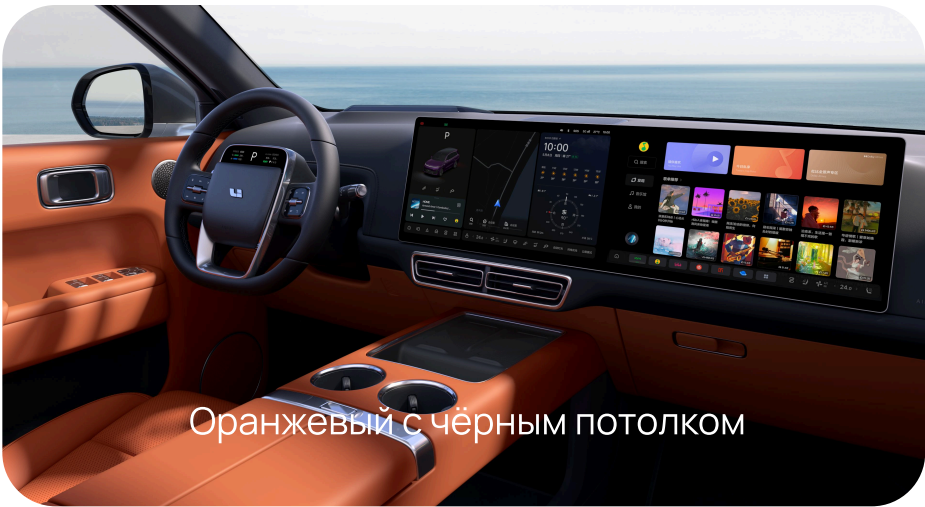
Оранжевый с чёрным потолком